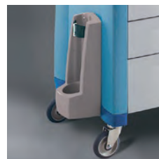
Soporte para tanque de oxígeno