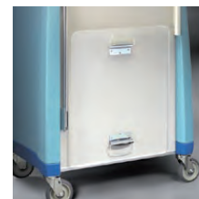
Tabla para masaje cardiaco