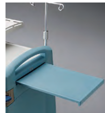
Repisa lateral corrediza