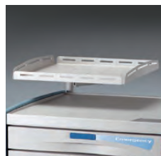
Base para desfibrilador